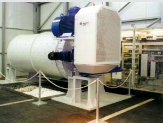
Kugelmühle mit Direktantrieb bis 355 Kilowatt über Seitenschild

Schaumglas, manchmal auch Blähgas genannt, ist ein moderner Zusatzstoff in der Baustoffindustrie und vereinfacht ausgedrückt ein hochporiges Korn, das in verschiedenen Einzelschritten aus Altglasscherben thermisch gewonnen wird. Schaumglasprodukte verfügen über ausgezeichnete Schall- und Wärmedämmungseigenschaften – nicht nur Spachtelmassen oder Putze, sogar komplette Wandelemente können daraus hergestellt werden, bei üblichen Wandstärken sind meist keine zusätzlichen energiesparenden Wärmeschutzmaßnahmen nötig. Ein bekannter Lieferant für Schaumglas-Zusatzstoffe ist die Dennert Poraver GmbH.